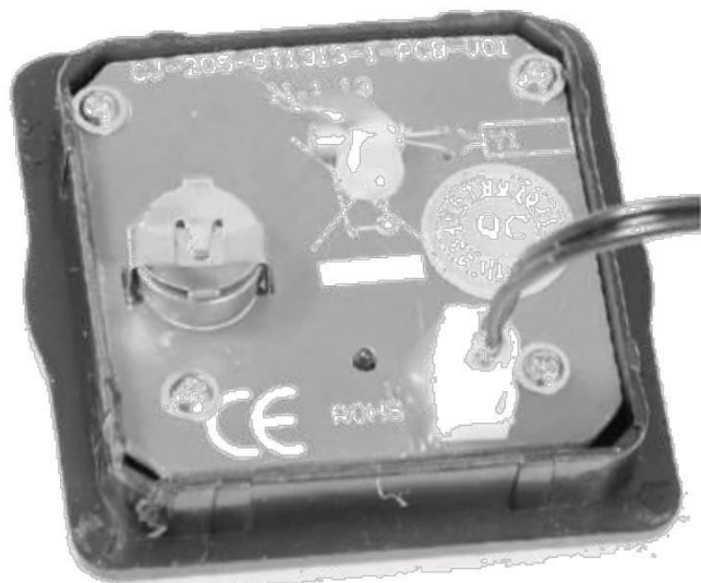
1 x Алкална батерия

Отворете компютъра (част: 22). Поставете батерията в правилната позиция