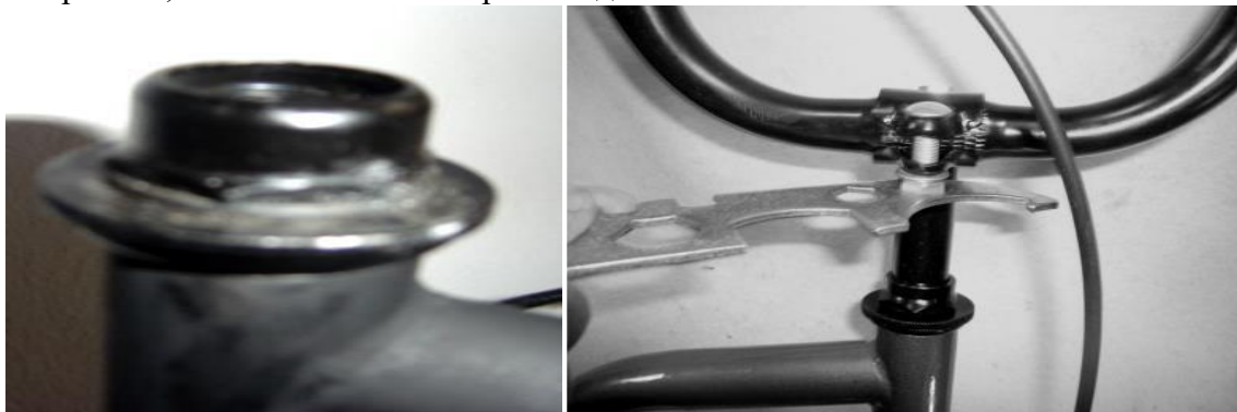
(c) Вилична тръба

Инсталирайте стеблото на дръжките на дръжката в тръбата на вилицата, в положение успоредно на предното колело. Затегнете болта на стеблото с помощта на гаечен ключ. Уверете се, че стеблото е монтирано под знака за максимална височина.